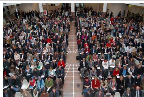
Zentrale Auftaktveranstaltung „Forum Soziale Stadt“ am 21. Februar 2008 in der Bürgerhalle des Dortmunder Rathauses mit über 500 Teilnehmer/innen.

Wie kann aus einem benachteiligten Sozialraum ein Aktionsraum werden? Über 2.000 Personen aus Politik und Verwaltung, Verbänden und Kirchen, Vereinen und Organisationen beteiligten sich an den Diskussionen in insgesamt fast 30 Veranstaltungen und engagierten sich in Facharbeitsgruppen. Unbeschadet aller individuellen Abweichungen in den Aktionsräumen – so das zentrale Ergebnis des Beteiligungsprozesses – konzentrieren sich in ausnahmslos allen benachteiligten Quartieren die wesentlichen Bedarfe auf drei