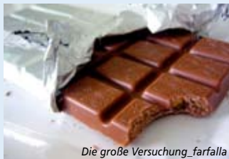
Die große Versuchung_farfalla

Veranstaltungsort: Verbraucherzentrale NRW Gnadenort 3–5 44135 Dortmund