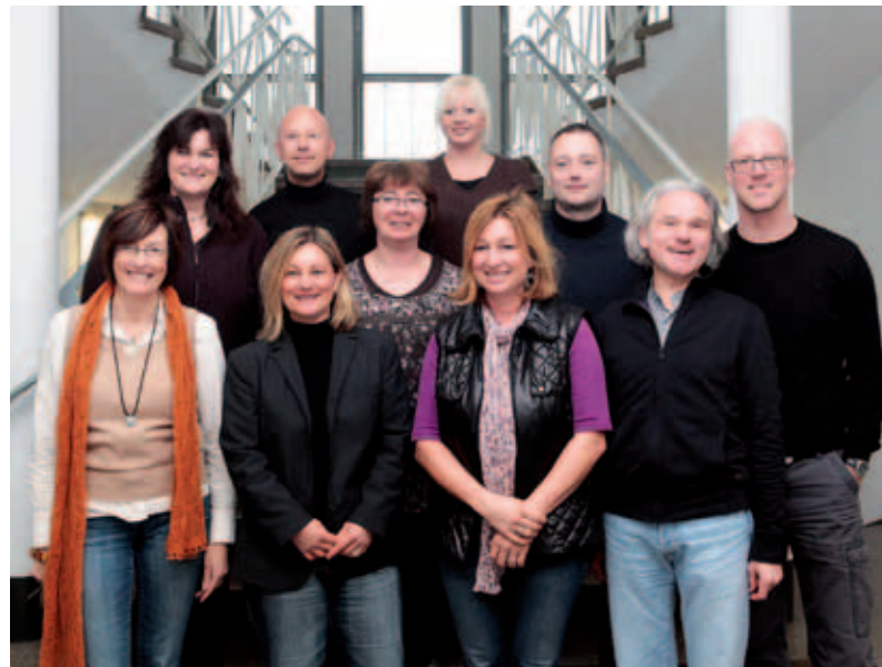
Das Kompetenzteam Pflege und Behinderung des Sozialamtes