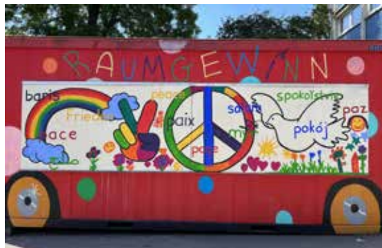
начален клас 3 ЕРС