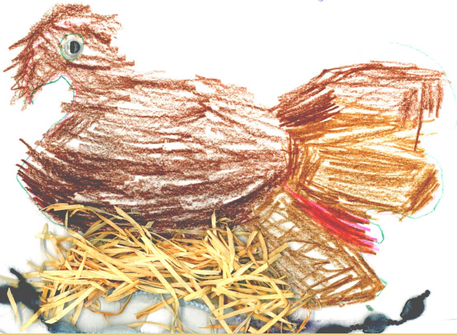
Bensu, AWO Kita + FZ Braunschweiger Straße