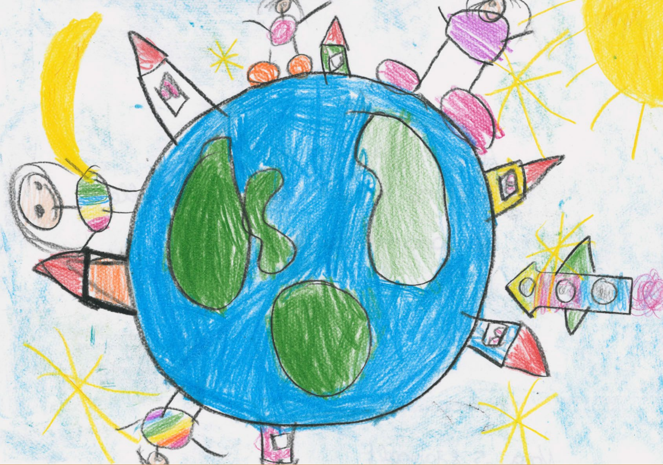
Nora, AWO Kita + FZ Am Bruchheck