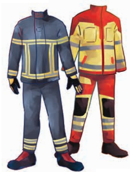
Работно облекло в пожарната станция и спешната служба