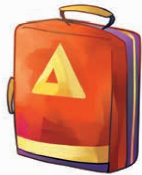
Раница с материали за първа помощ