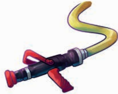
Стюманена тръба с маркуч