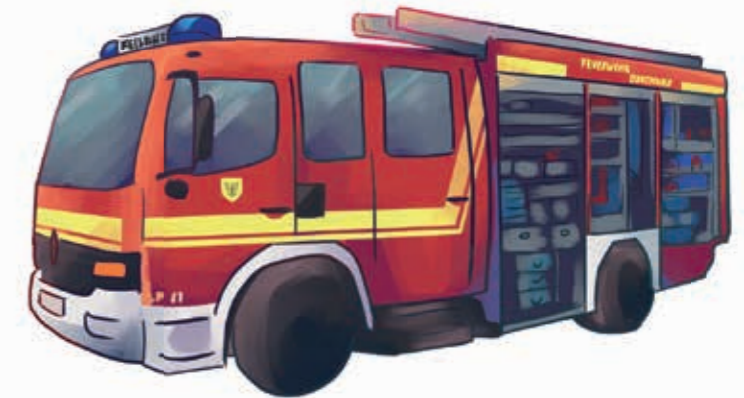
Противопожарен автомобил за техническа помощ