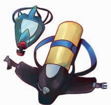
Aparat oddechowy z maską