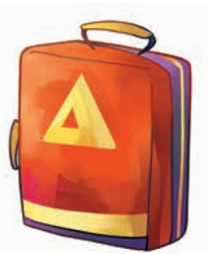
Plecak z ekwipunkiem ratowniczym