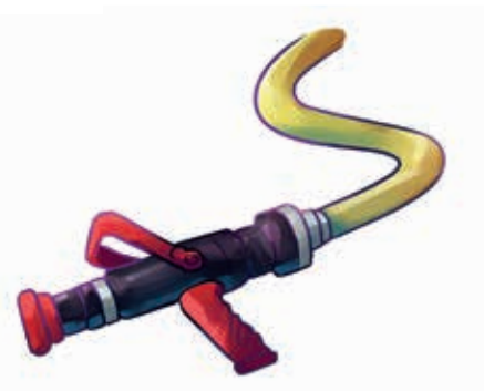
Lanca gaśnicza z wężem