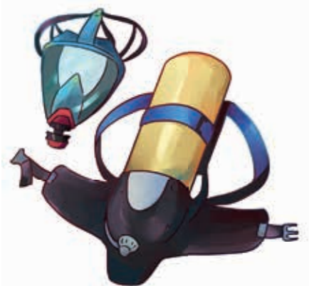
Aparat de respirație cu mască