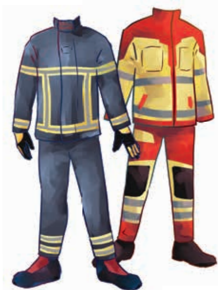
Îmbrăcămintea pompierilor și a serviciului de salvare