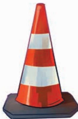
Con de semnalizare în trafic