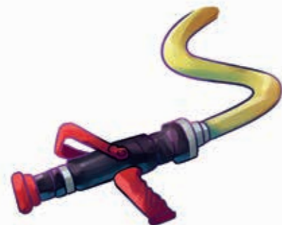
Țeavă cu jet cu furtun