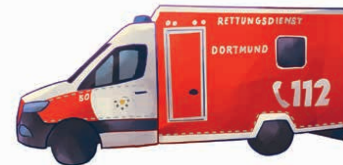
Автомобіль швидкої допомоги