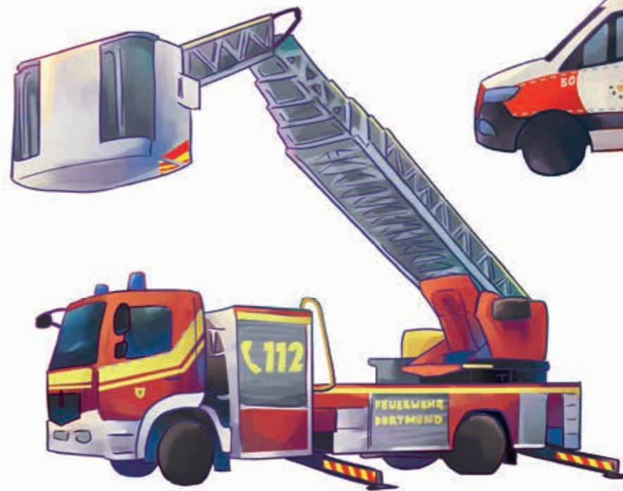
Поворотна грабина з люлькою