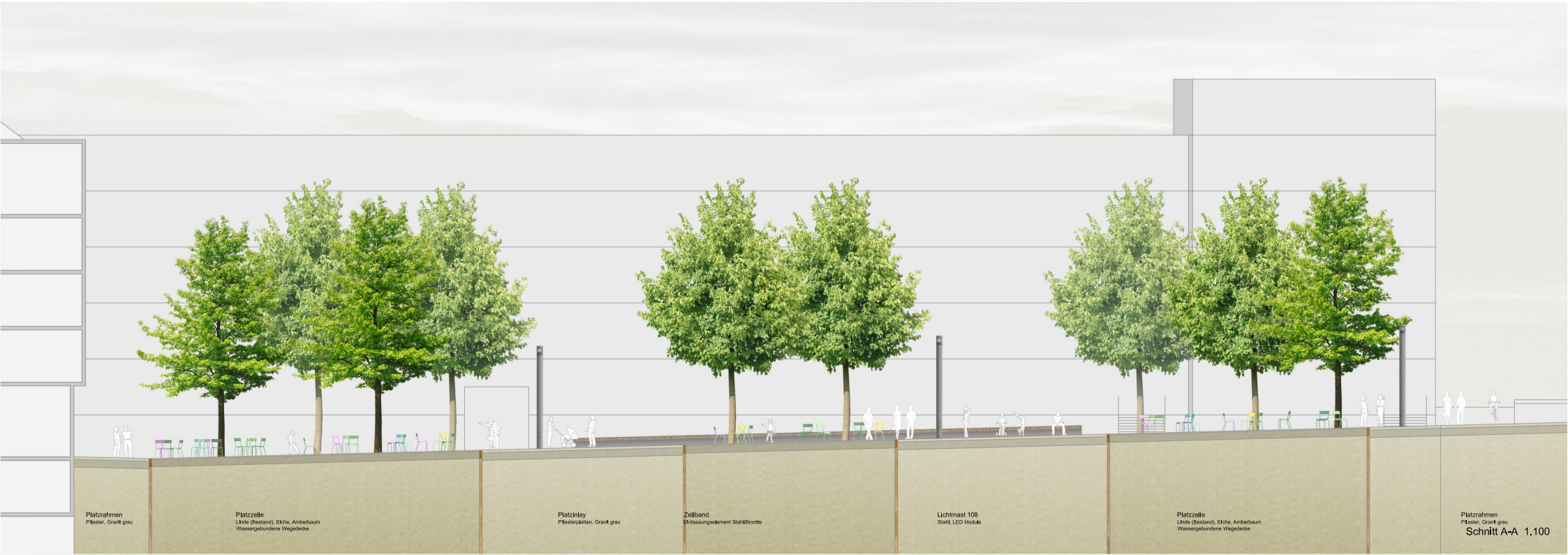
Schnitt A-A 1:100