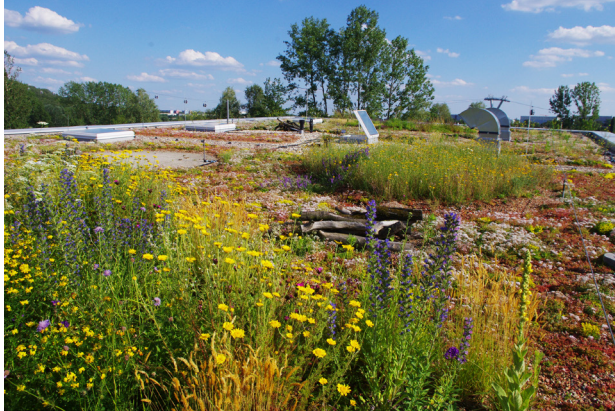
Eine Dachbegrünung erhöht die Biodiversität von Pflanzen und Tieren im Stadtgebiet.

Mitten in der Stadt leben und trotzdem Natur genießen: Eine Dachbegrünung macht's möglich. Ob begehbare Gartenoase in luftiger Höhe oder pflegeleichte Gras- und Moosbepflanzung, eine Dachbegrünung kann den individuellen Wünschen angepasst werden. Dabei bestimmen Neigung, Tragfähigkeit, Nutzung und Witterung, welches Grün auf welches Dach passt. Damit Dortmund von den Vorteilen für Mensch und Umwelt profitiert, soll die Dachbegrünung als stadtoökologischer Beitrag Normalität werden.