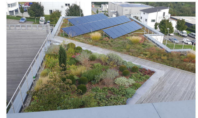
Durch den kühlenden Effekt der Bepflanzung, erhöht eine Dachbegrünung den Wirkungsgrad einer Photovoltaik-Anlage.