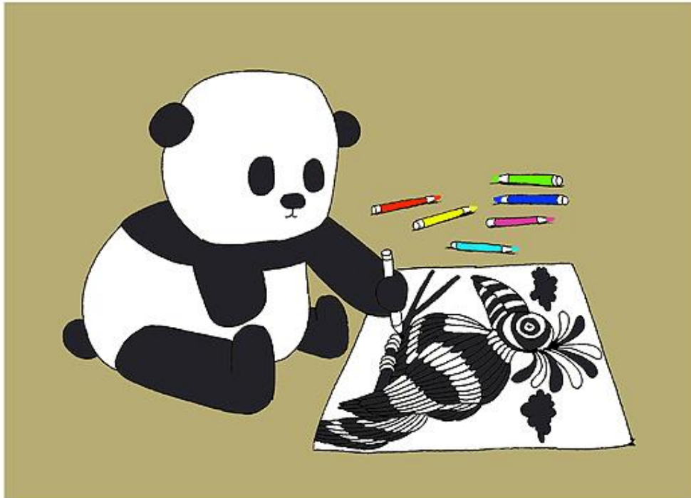
„Prejudice / Vorurteil“ von Berk Olgun (Türkei): Das schwarzweiße Bärchen dem es unmöglich ist, sein Gegenüber in bunten Farben darzustellen...

ungeläufigen Wörtern, Namen und Sprachen im einzelnen Individuum zur Furcht mutiert und, einmal in der Gruppe verankert, in Hass und Gewalt umschlägt.