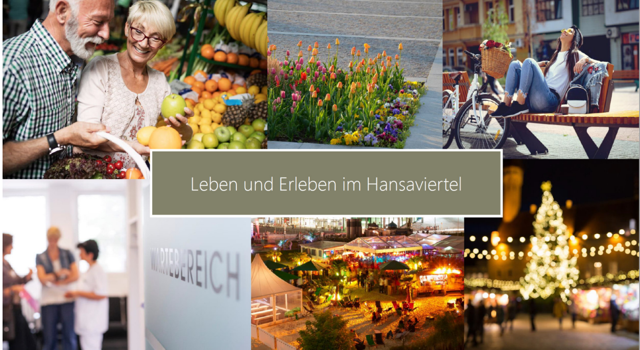
Leben und Erleben im Hansaviertel