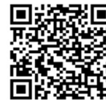
Friedhöfe Dortmund im Internet