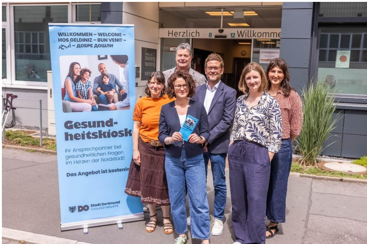
Abbildung/Tabelle 2: Eröffnung des Dortmunder Gesundheitskiosks