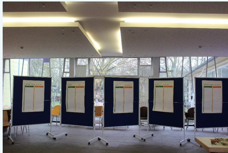
Anmeldeplakate in der Mittagspause