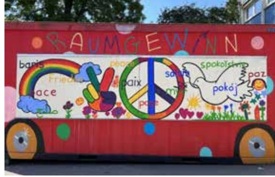
Başlangıç sınıfı 3 EPC