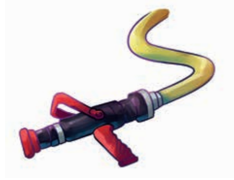
أنبوب شعاع الماء بخرطوم