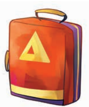
حقيبة الظهر للطوارئ