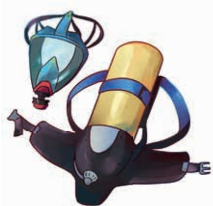
Appareil respiratoire avec masque