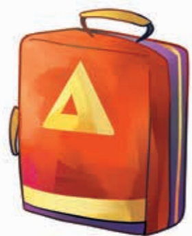
Sac à dos d'urgence