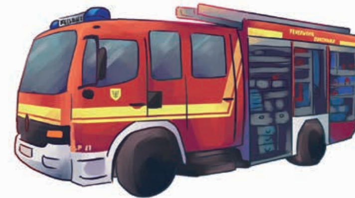
Véhicule d'aide à la lutte contre l'incendie