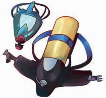
Solunum cihazı ve maske