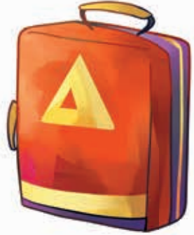
Acil durum sırt çantası