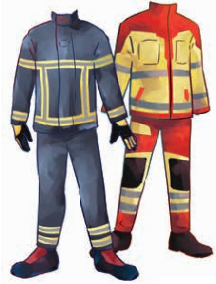
İtfaiye ve kurtarma hizmeti üniformaları