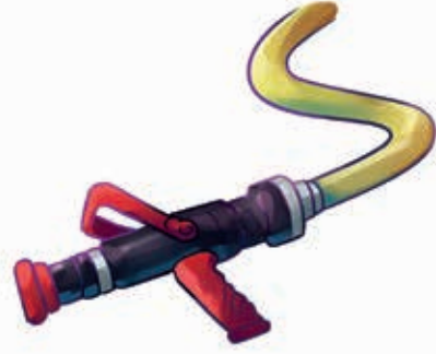
Püskürtme borusu ile hortum