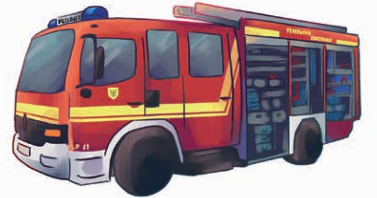
Yangın söndürme aracı