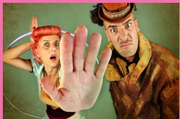
Clap Clap Circo