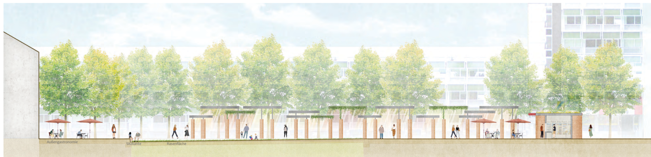
Schnitt | M 1:100