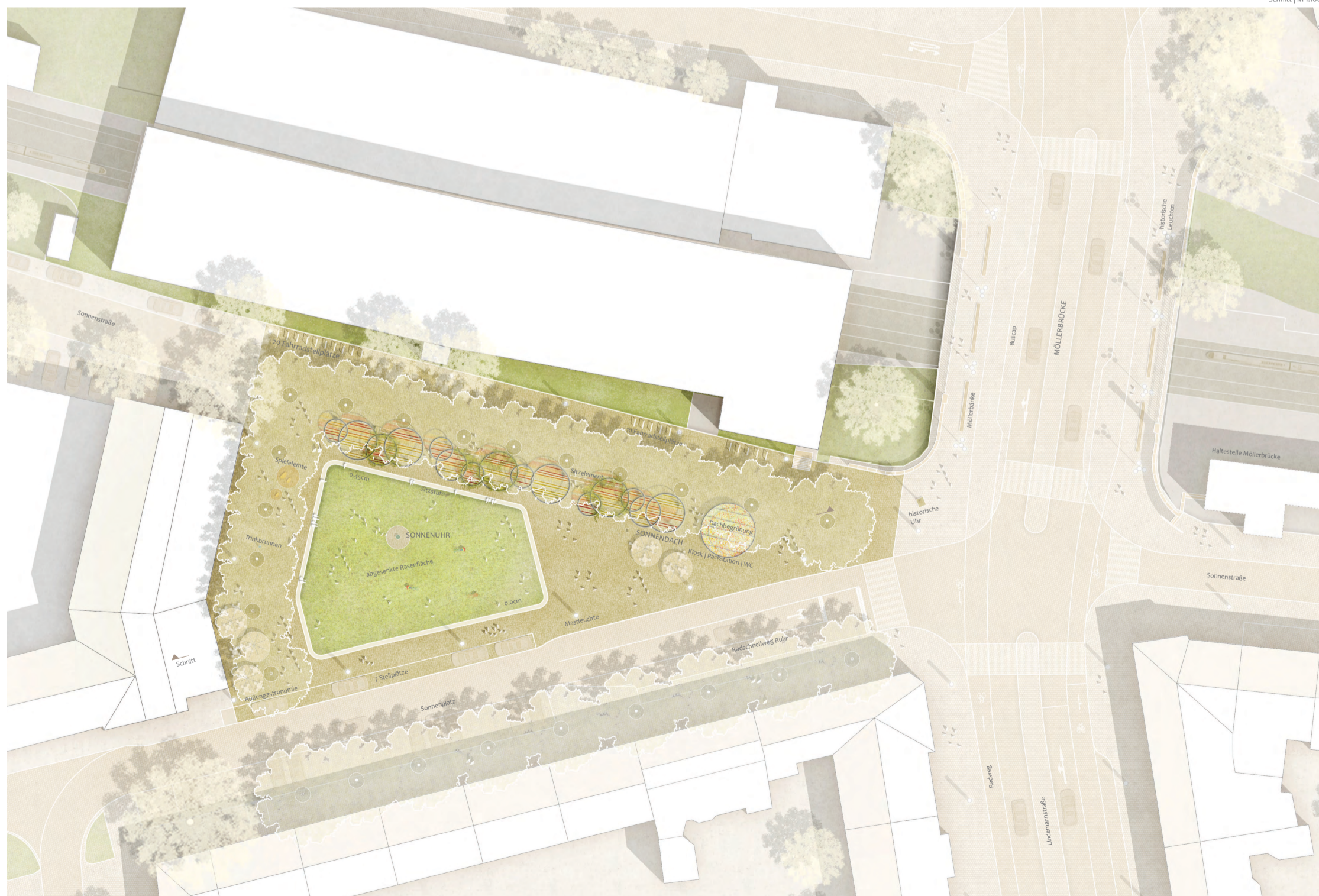
Lageplan | M 1:200