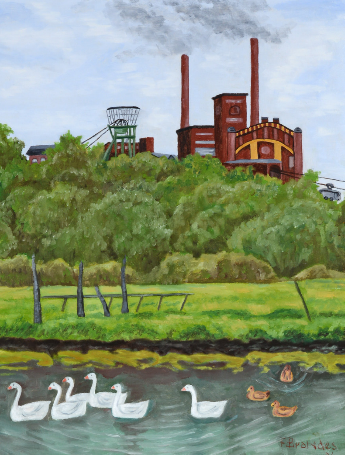
Franz Brandes, Schwäne und Enten vor der Zeche Zollern II/IV, 1986, Öl auf Leinwand

© Franz Brandes Leihgabe LWL-Industriemuseum Westfälisches Landesmuseum für Industriekultur, Dortmund