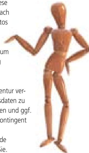
Beispiel: Zu geringe Auflösung des Fotos

Die Dortmund-Agentur verfügt über Zugangsdaten zu diesen Datenbanken und ggf. über ein Credits-Kontingent zum Fotoankauf. Die Kosten für beide Varianten tragen Sie.