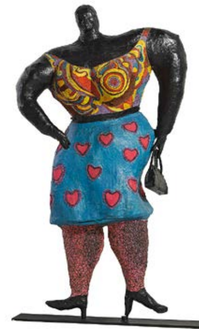
Abb. oben: Niki de Saint Phalle, Black Rosy or My Heart Belongs to Rosy, 1965, 225 x 150 x 85 cm

Die Menschen auf Niki de Saint Phalles Bildern und ihre Skulpturen sind groß und farbenfroh. Sie scheinen sich immer zu bewegen: Sie tanzen, recken sich, fliegen oder springen. Wir probieren aus, welche Bewegungen unsere Körper machen können, und fangen diese Bewegungen in Umrisszeichnungen ein, die wir knallbunt gestalten.