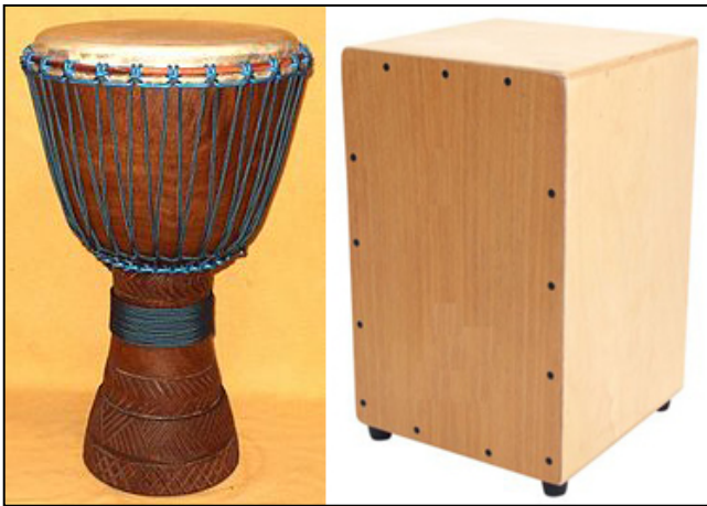
Djembé & Cajon