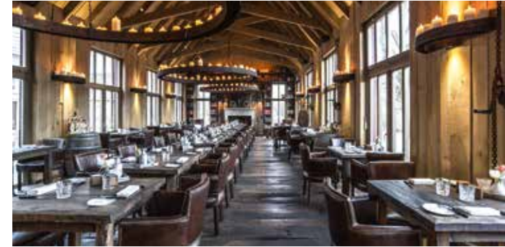
„Hohoff's 800° - New American Steakhouse“

Wer etwas unternehmen will, wird in den nördlichen Stadtbezirken Überraschendes erleben.