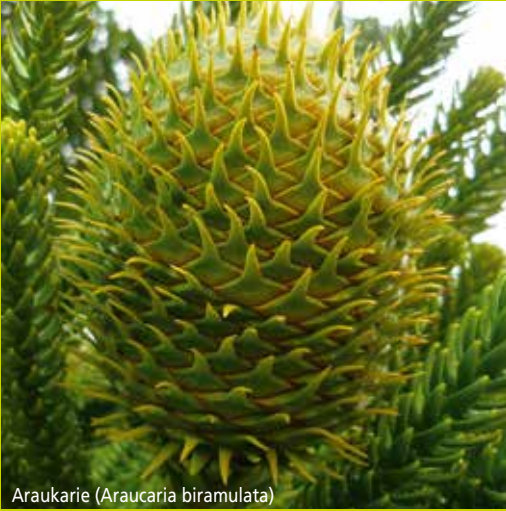
Araukarie ( Araucaria biramulata )