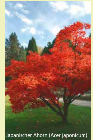
Japanischer Ahorn ( Acer japonicum )