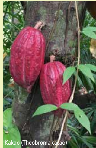
Kakao ( Theobroma cacao )

Freitags sind die Schauhäuser erst ab 14.00 Uhr geöffnet.