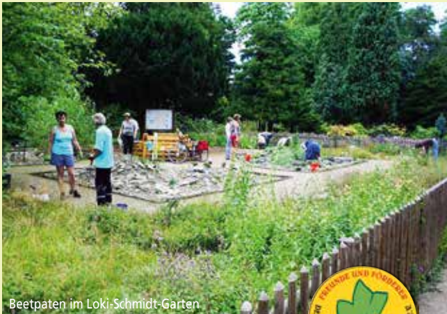
Beetpaten im Loki-Schmidt-Garten