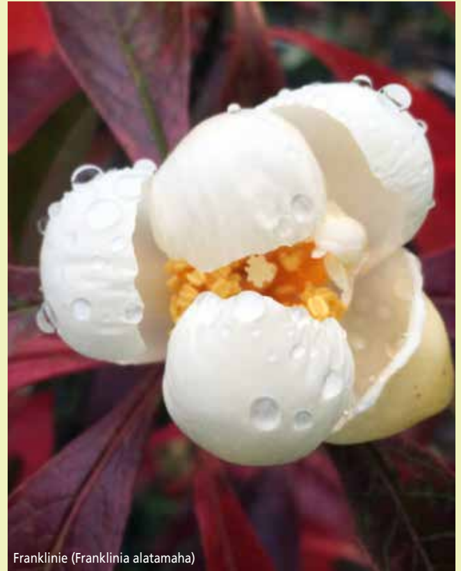
Franklinie (Franklinia alatamaha)