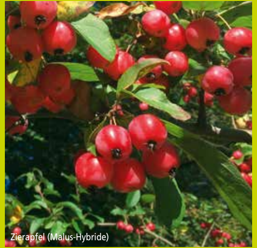
Zierapfel ( Malus -Hybride)