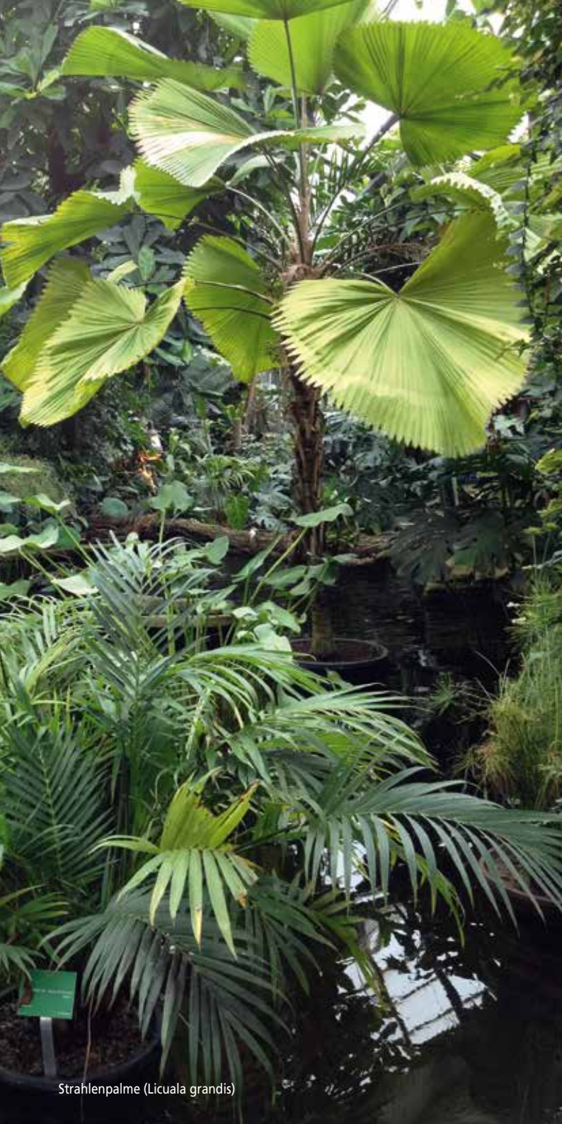
Strahlenpalme ( Licuala grandis )