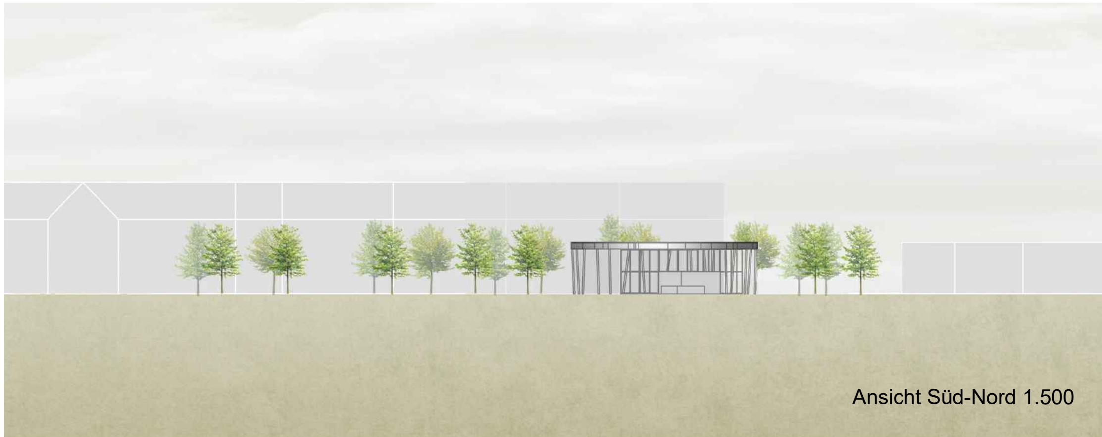
Ansicht Süd-Nord 1.500