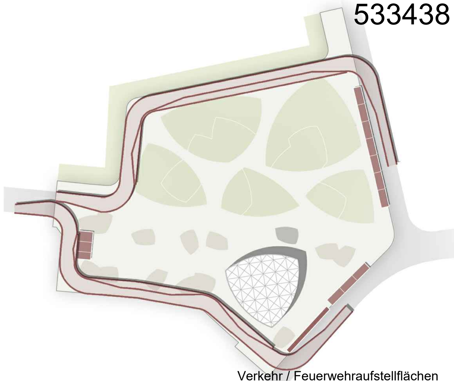
Verkehr / Feuerwehrauffstellflächen